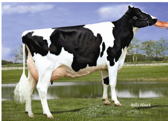
LADYS-MANOR RUBY D SHAWN GRANDDAM